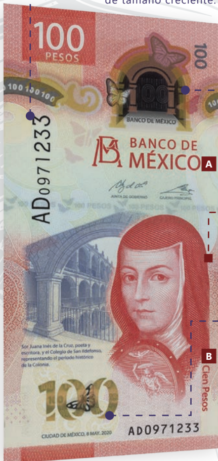
ANVERSO PROCESO HISTÓRICO DE LA COLONIA.

Folio vertical con dígitos de tamaño creciente.